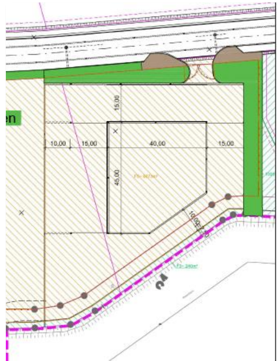
Darstellung Bereich des Ansiedlungsgrundstücks ohne Oberflächenbefestigung