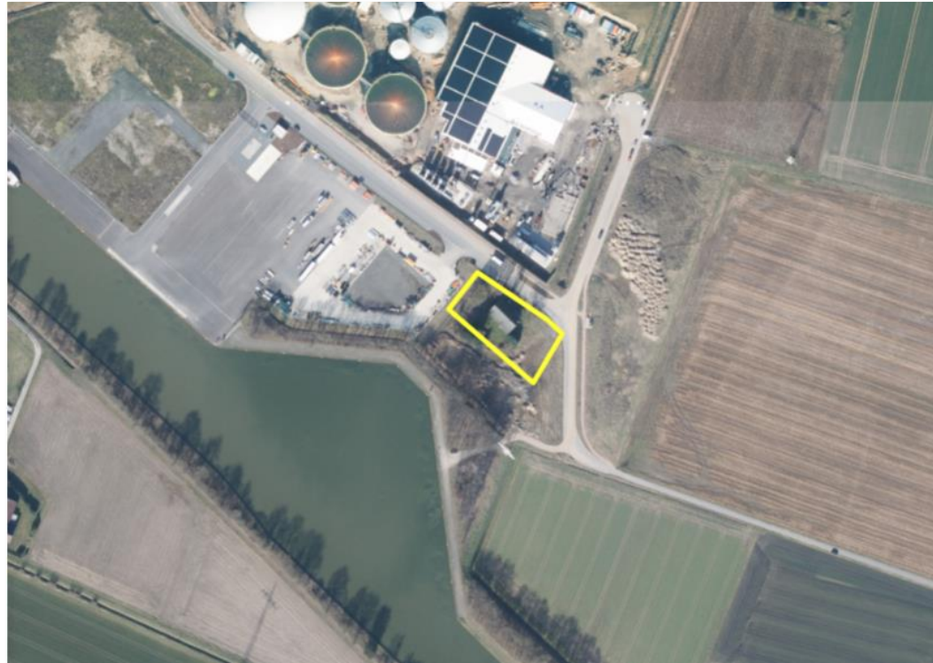
Luftbild; Erweiterungsfläche Bürohaus gelb in ungefährender Lage eingezeichnet.