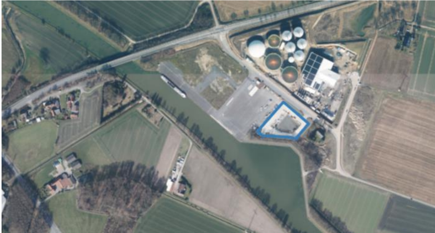
Luftbild; Ansiedlungsgrundstück blau in ungefähre Lage eingezeichnet.