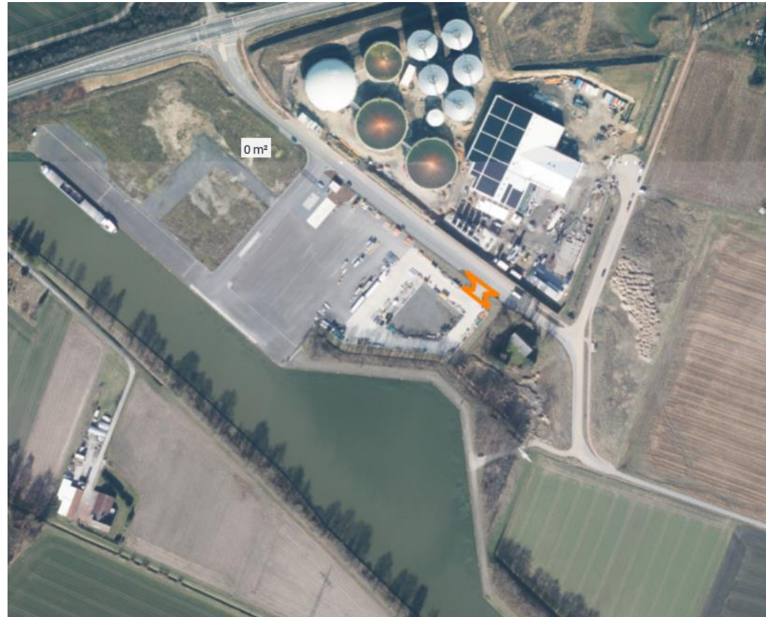
Luftbild; Zufahrt orange in ungefährender Lage eingezeichnet.