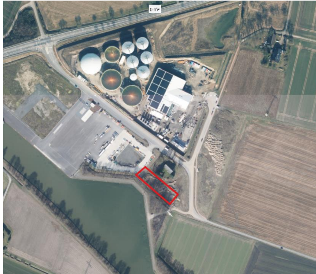
Luftbild (Quelle: https://www.geobasis.niedersachsen.de/ ); Erweiterungsfläche Bedarf gelb in ungefährer Lage eingezeichnet.